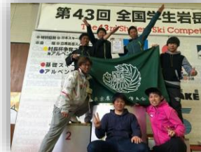
スキー部現役支援