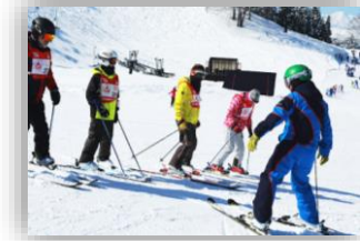
スキースクール開催・クラブチーム化促進