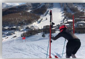
OB戦タイムレース・岩岳OB戦への参加