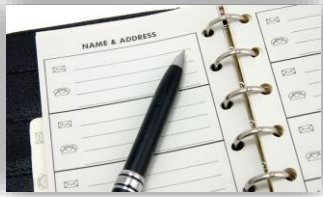
名簿の再整備・コミュニケーションツール