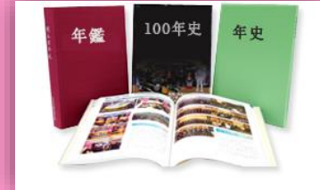
スキー部 50年史の作製・機関誌発行